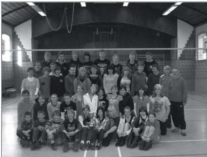
Wettkämpfer und Sportlehrer mit dem Pokal