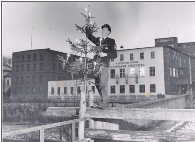
Bis in die 1950er Jahre hinein stellten Bayerische Grenzpolizisten alljährlich auf der Brückenruine in Tiefengrün einen Weihnachtsbaum auf.

In nur einer Woche errichtet der Kreisbauhof des Landkreises Hof auf den Brückenresten der Heinrich-Knoch-Brücke eine Fußgängerbrücke. Die sogenannte „Brücke der Freiheit“ wird am 30.12.1989 als Grenzübergang eingeweiht. Am folgenden Tag begrüßen die Menschen diesseits und jenseits der Saale gemeinsam das neue Jahr.