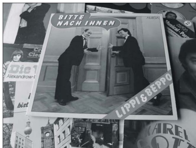
Schallplatten in Hülle und Fülle gibt es am 1. Dezember auf dem Adventsmarkt in Gefell

Realsatire par excellence liefert die gut erhaltene Langspielplatte „Unser Lied, unser Leben“. Unter anderem mit dem Singleclub der Grenztruppen der DDR und ihrem recht amüsanten Song „Postengang“, der es selbstverständlich nicht in die Charts schaffte. Aufgrund einer großzügigen Spende der Familie Künzel können am Tisch der Stadtbibliothek Gefell anlässlich des Adventsmarktes noch viele CDs unterschiedlichster Genres aus zweiter Hand für ganz wenig Geld erworben werden.