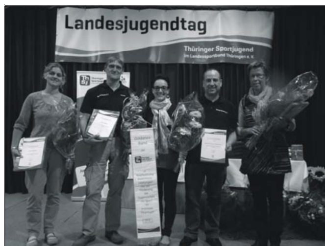
Am 22.09.2012 wurde der Banzai-Karate E.T. Hirschberg/Saale e.V. anlässlich des Landesjugendtages mit der höchsten Auszeichnung der Thüringer Sportjugend in Anerkennung besonderer Leistungen bei der Förderung der Jugendarbeit im Sport im Freistaat Thüringen ausgezeichnet.