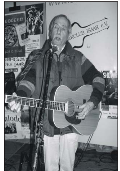
Mit dem Irish-Folk-Musiker Pat Cooksay kommt ein Publikumsliebbling zum Sommerfest

Gezeigt werden an diesem Abend farbenfrohe Aufnahmen aus Transsylvanien, dem sogenannten „Land hinter den Wäldern“. Einem kulturell hoch interessanten Gebiet, wo bereits im 12. Jahrhundert deutsche Kolonisten - die späteren „Siebenbürger Sachsen“ - angesiedelt wurden. Alle Veranstaltungen beginnen um 20 Uhr.