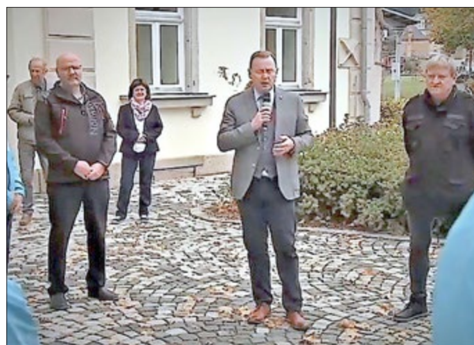
Ansprache des Ministerpräsidenten Thüringens an die Teilnehmer des Friedenslaufes vor dem Museum

„Ein tolles Museum und eine gute Entwicklung für die Region. Hirschberg ist immer eine Reise wert“ schrieb der erste Repräsentant Thüringens in das Gästebuch des Museums.