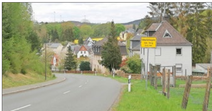
Weitblick von Tiefengrün nach Thüringen