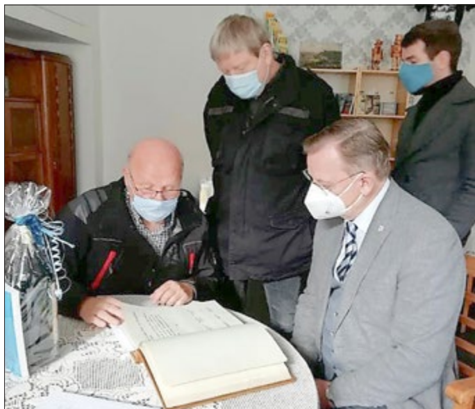
Bodo Ramelow und Ralph Kalich (Mitte) beim Eintrag in die Gästebücher der Stadt Hirschberg und des Museums

gend positive Resonanz. Von einigen Hirschberger Besuchern wurde zu Recht bemängelt, dass die Geschichte der Lederfabrik von 1945 bis 1990 sowie die Stadtgeschichte zu kurz abgehandelt wurden. Wir werden versuchen, im Rahmen der uns zur Verfügung stehenden begrenzten technischen und finanziellen Mittel diese Lücke zu füllen. Ideen dazu sind reichlich vorhanden. Hinweise (auch kritische!) nehmen wir selbstverständlich weiterhin gerne entgegen.