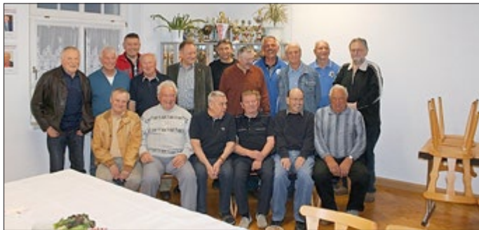
(Fotos: Treffen der „Ehemaligen“ am 29.11.2013 (oben) und 24.4.2015 (unten),)