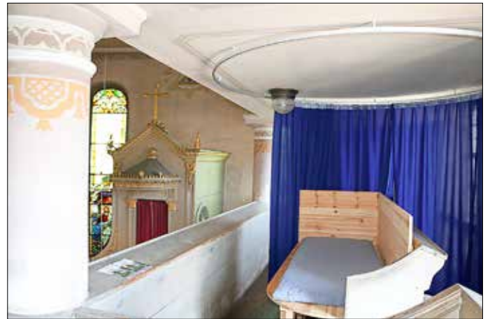
Das Hirschberger Gotteshaus ist eine Herbergskirche.