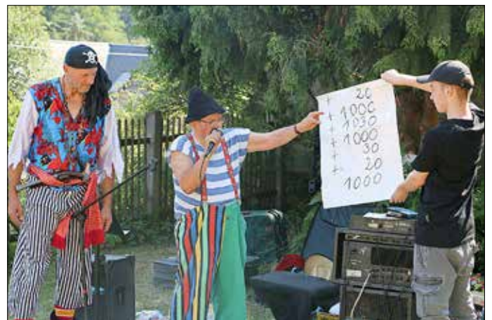
Zwei Clowns hatten Späße auf Lager.