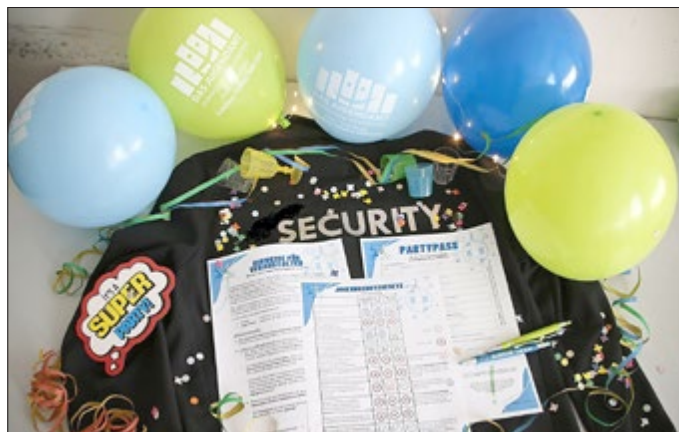
Illustration / Foto: Brit Wollschläger/ Landratsamt Saale-Orla-Kreis